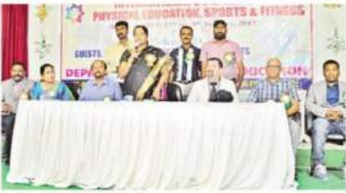
మాజీ క్రీడాకారులు, కేంపస్ ప్రొఫెసర్లు, డాక్టర్ల సందర్శన