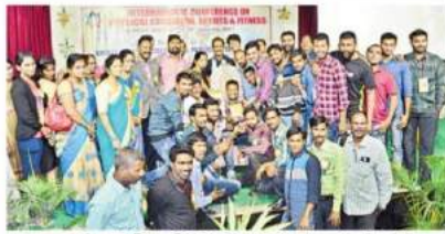
కాన్వెన్షన్, లగ్డెజల్ ప్రజాతరంగం, సమ్మానితలు, ప్రశస్తినిధులు, విజేతల డైరెక్టులు