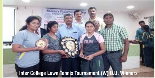
Inter College Lawn Tennis Tournament (W) O.U. Winners