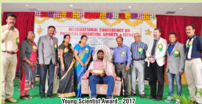
Young Scientist Award - 2017