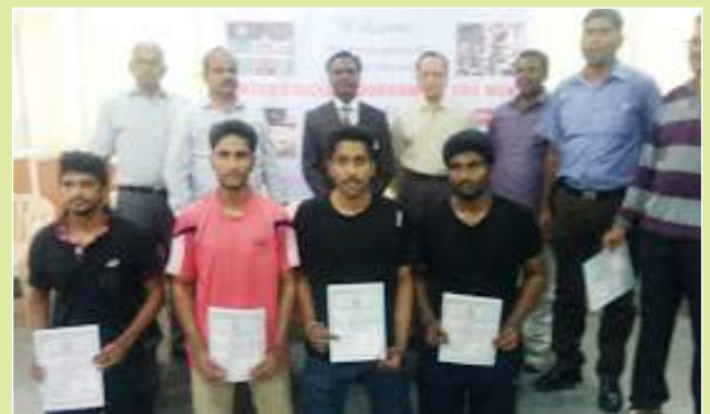
Inter College Badminton Tournament O.U. Fourth Place