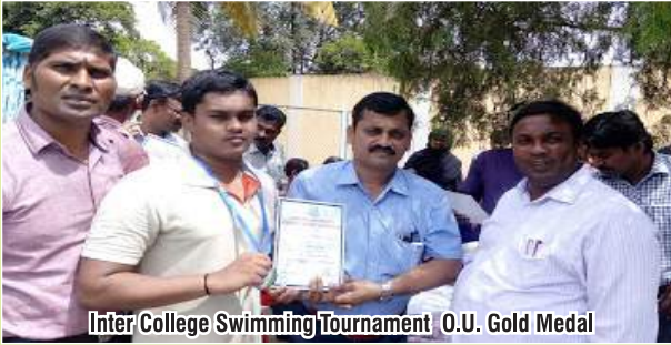
Inter College Swimming Tournament O.U. Gold Medal